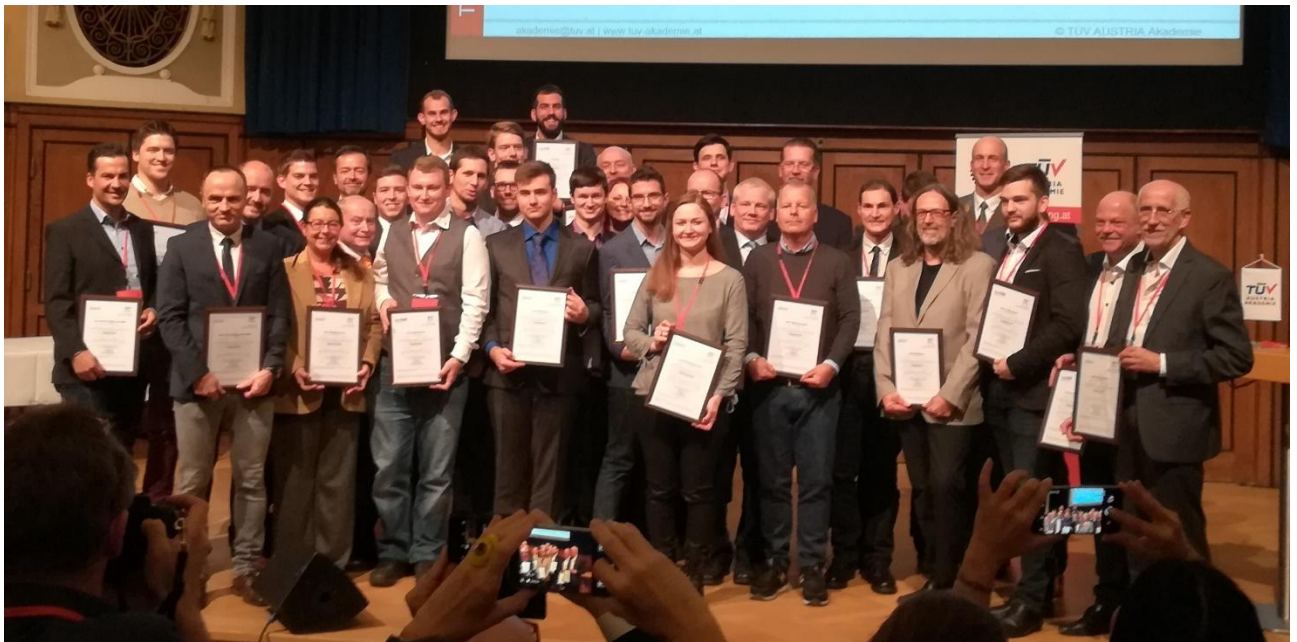
Gesamtaufnahme der graduierten Kandidaten

Geehrt bzw. Graduiert wurden 30 KandidatInnen aus den verschiedensten technischen Fachgebieten. Die Hauptfachrichtungen waren Maschinenbau, Elektrotechnik und Bautechnik. Aber auch Fachgebiete wie Ofenbautechnik, EDV-Technik, Flugtechnik, Innenraum- und Holztechnik waren unter den Graduierungen.